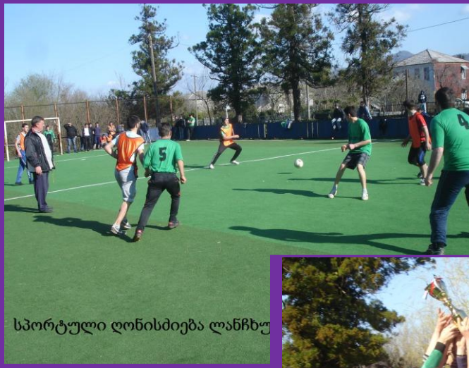
სპორტული ღონისძიება ლანჩხუთში