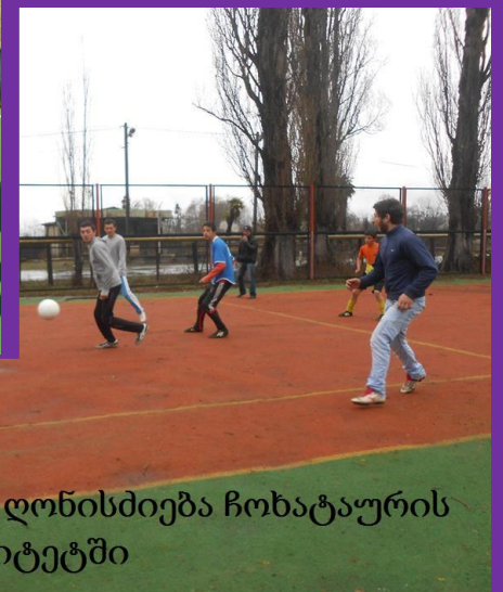
სპორტული ღონისძიება ჩოხატაურის მუნიციპალიტეტში

დამატებითი ინფორმაციისათვის დაგვიკავშირდით: გურიის ახალგაზრდული რესურსცენტრი ოზურგეთი, რუსთაველის ქ. #4 ტელ: 0496 27 41 26 gyrc.info@gmail.com